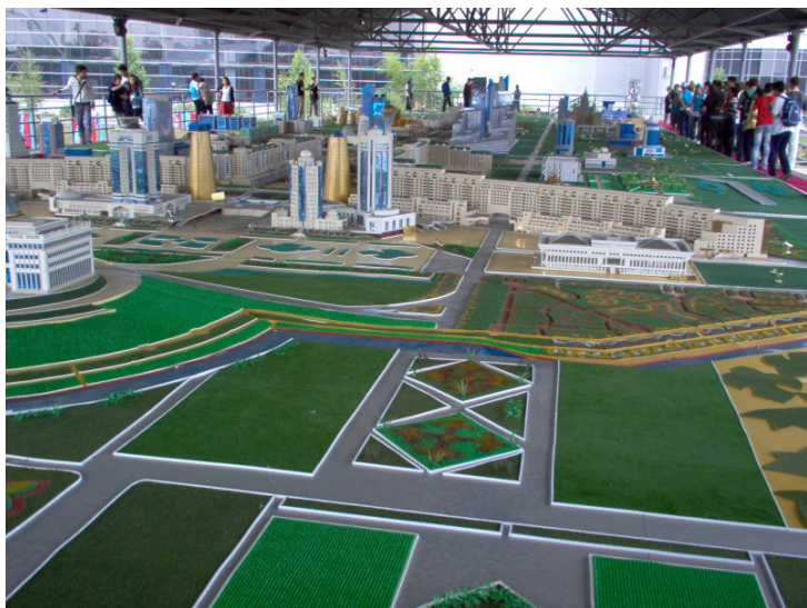
Tak o tohle jsem přišel.