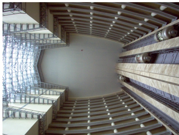
Výtahy v Hotelu 1

Za dveřmi, k nimž jsme měli kartičku, byly pokoje hned tři. Ukázalo se však, že dva z nich budeme muset přenechat jiným IMO týmům. Náš pokoj nesousedil s koupelnou, takže bylo třeba jít přes pokoj jiného týmu. Byl jsem obeznámen s tím, že IMO tým vpravo obsahuje nepříjemné jedince, a je proto lepší používat koupelnu vlevo.