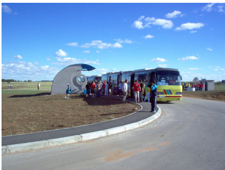
Přestávka, všimněte si fronty za autobusem

Následovala dlouhá jízda autobusem. Při cestě se jim jeden autobus rozbil, takže lidi z to-