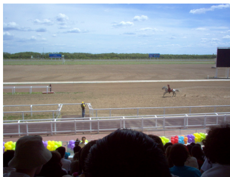
Představení jezdeckých sportů