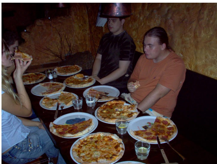
Vzpomínka na MEMO

A to je z prestižní matematické soutěže vše. Na závěr bych tu měl srovnání s MEMO: Autobusů bylo zhruba stejně, IMO nabídlo navíc nádhernou kombinatorickou úlohu, ale MEMO zase nosnější zážitky. Tím míním především dvanáct pizz pro šest lidí (protože nám tak vycházely stravenky) a Calábka uvízlého v lanovém parku.