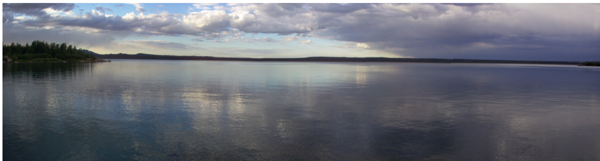
Jezero u Baldaurienu