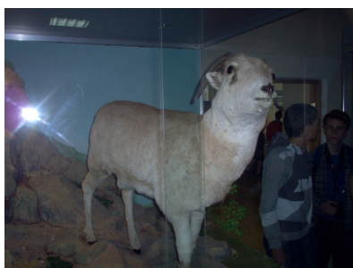
Jeden z exponátů

Po soutěži je na programu exkurze do národního parku Burabai. Byla to cesta autobusem se dvěma zastávkami. Na první zastávce bylo jakési muzeum s vycpanými zvířaty ve všelijakých polohách. Zabloudili jsme v něm až kamsi, kde to vypadalo, že po nás budou chtít peníze, tak jsme se raději stáhli.