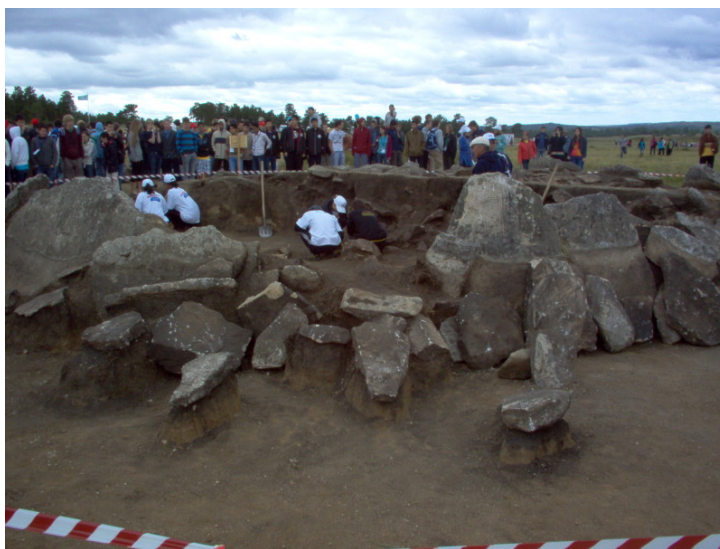
Hlavní turistická atrakce – lidi v ohrádce

Po chvíli zdejší exkurze končí a vracíme se autobusem zpátky. Tentokrát se věnujeme slovnímu fotbalu. Navržené pravidlo bylo, že je třeba navazovat na poslední dvě písmena. Jenže to je snadné dát dalšímu hráči slovo, které končí třeba na „ěk“, a tím ho vyřadit. Proto tu je ještě pravidlo, že pokud není vůbec možné vymyslet na poslední dvě písmena slovo, neprohrává ten, kdo je na řadě, ale ten, kdo to slovo zadal.