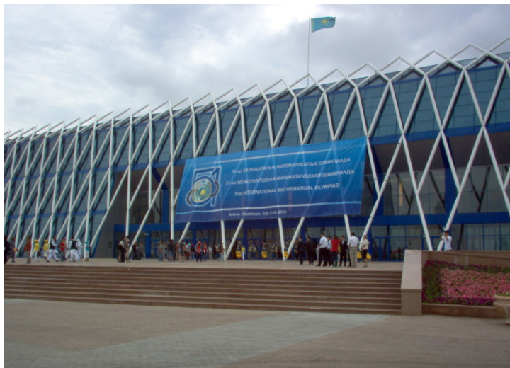
Palác nezávislosti – slavnostní zahájení uvnitř