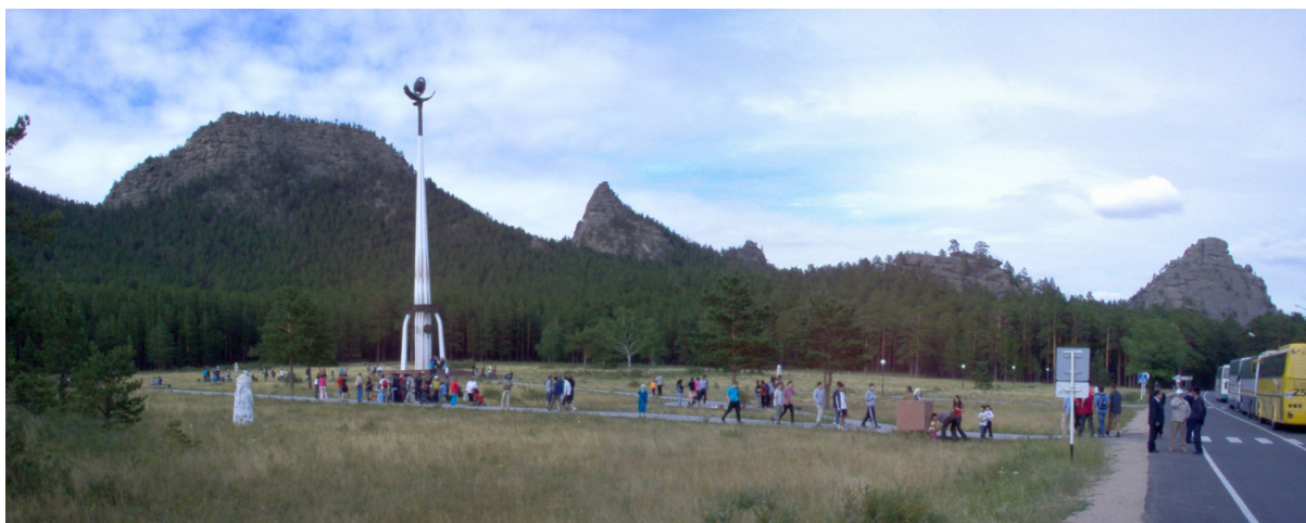
Exkurze do přírody

Při návratu k autobusům jsme si ještě zblízka prohlédli ten sloup. Dole byl tento sloup počmárán nějakými vandaly. Například tam bylo nakresleno srdíčko a v něm nápis „Astana“.